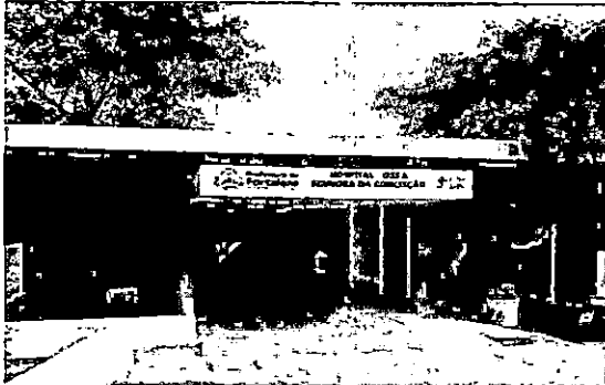
Hospital Nossa Senhora da Conceição - HNSC