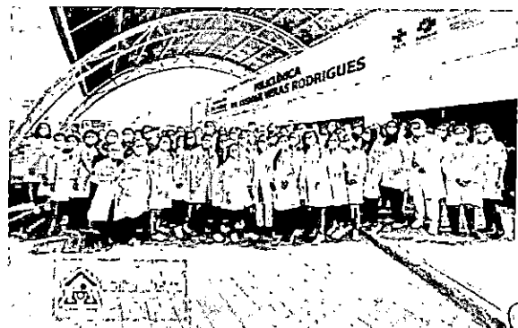
EMAD / EMAP