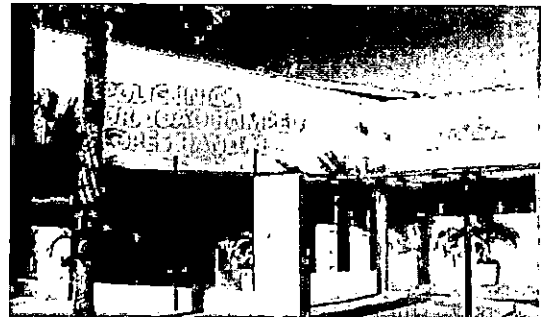
Policlínica Dr. João Pompeu Lopes Randal