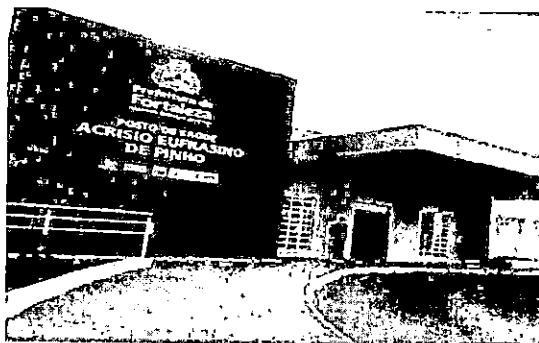
UAPS Acrísio EufRASino de Pinho