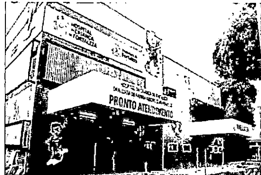
Hospital da Criança de Fortaleza - HCF